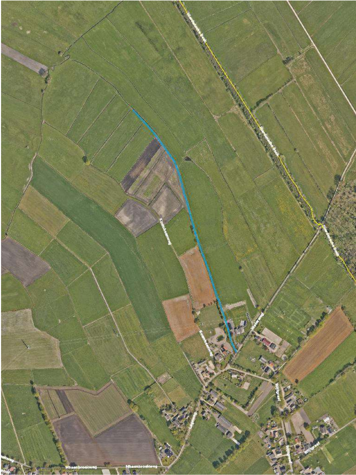
Weg nummer 237