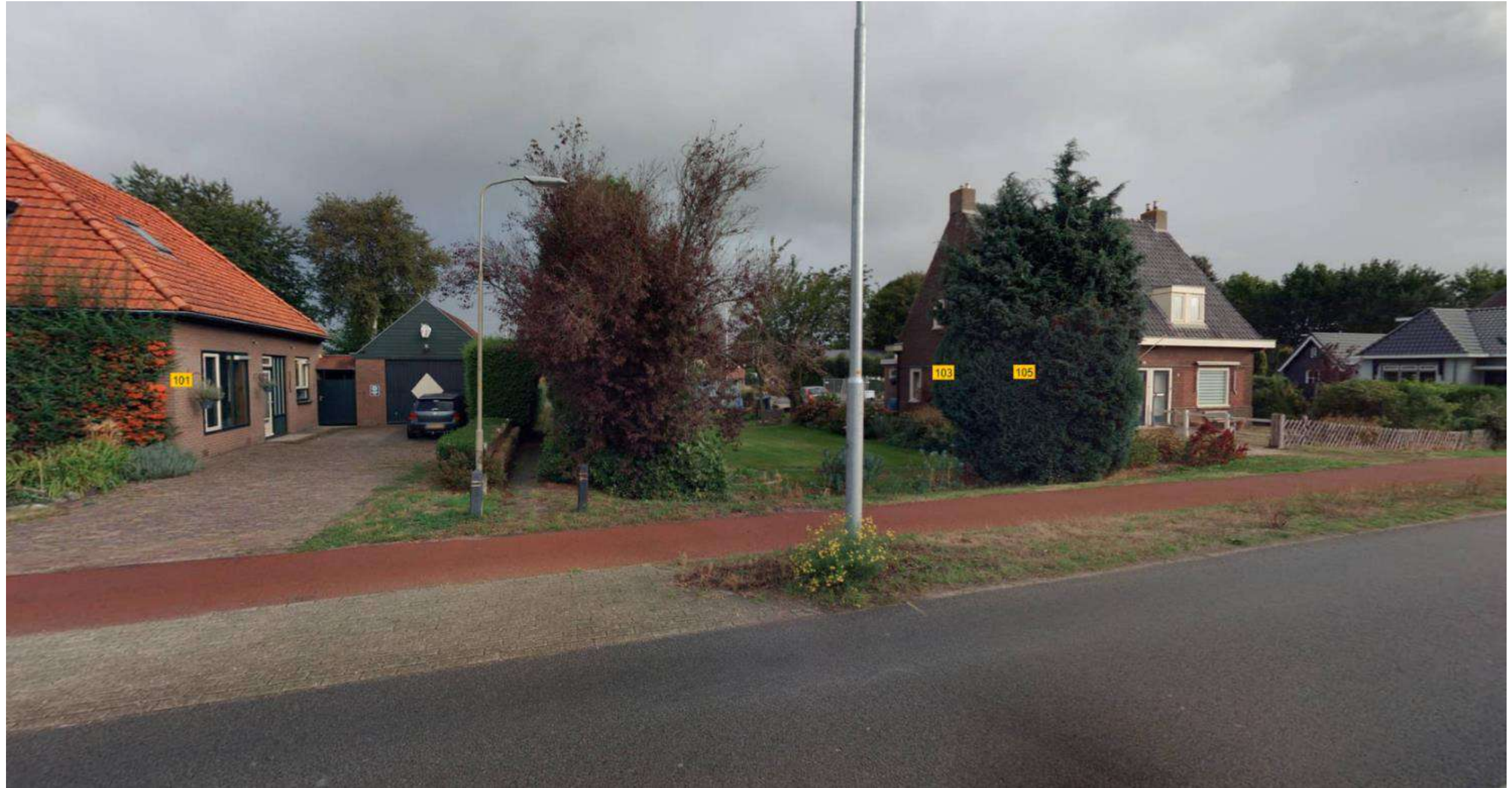
Pad Dorpshuisweg - Zuiderzeestraatweg