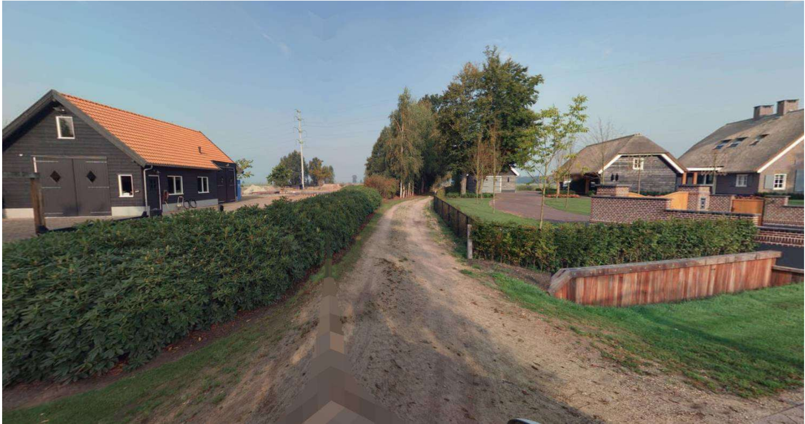
Weg nummer 237