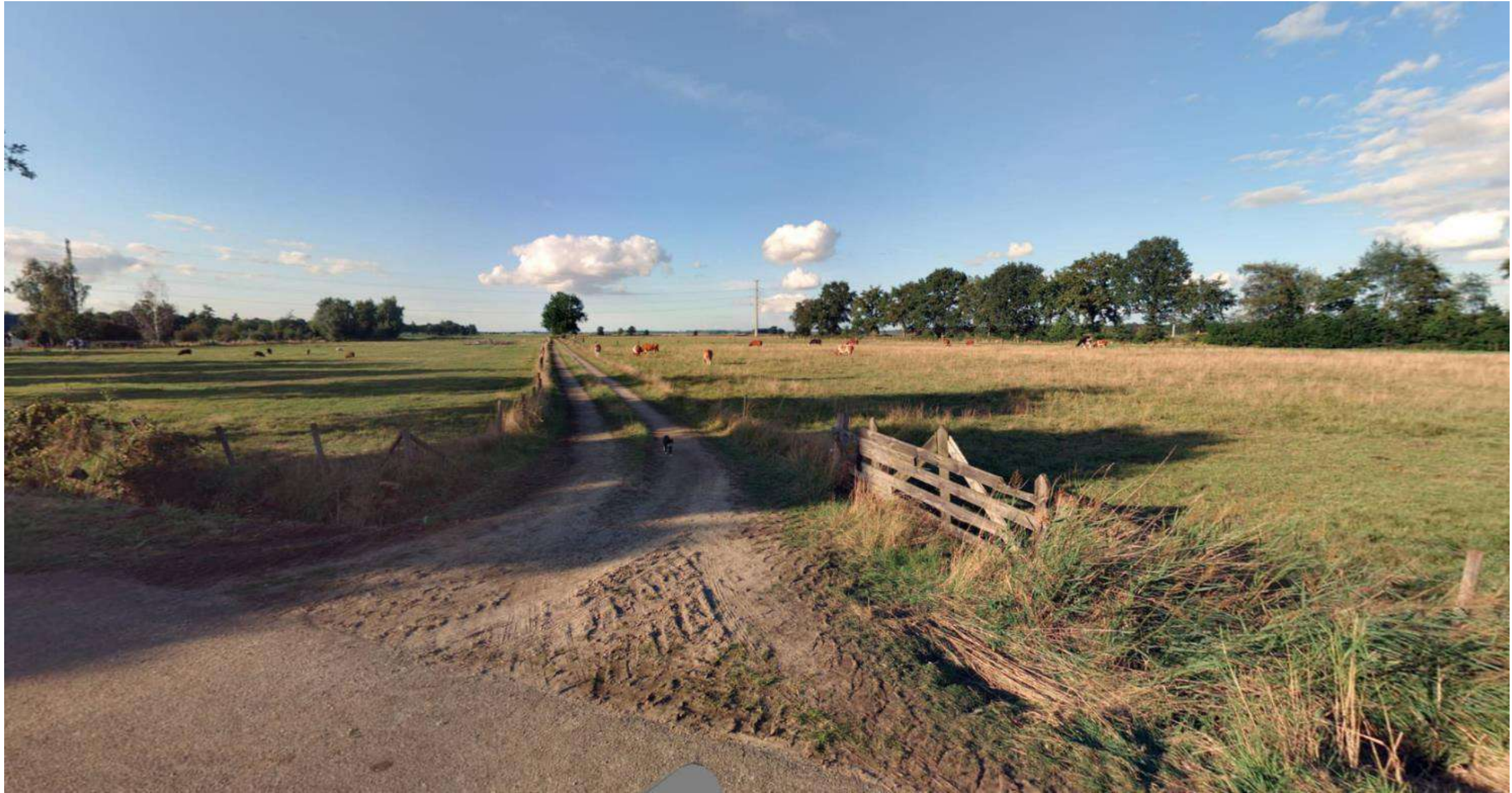
Weg nummer 236