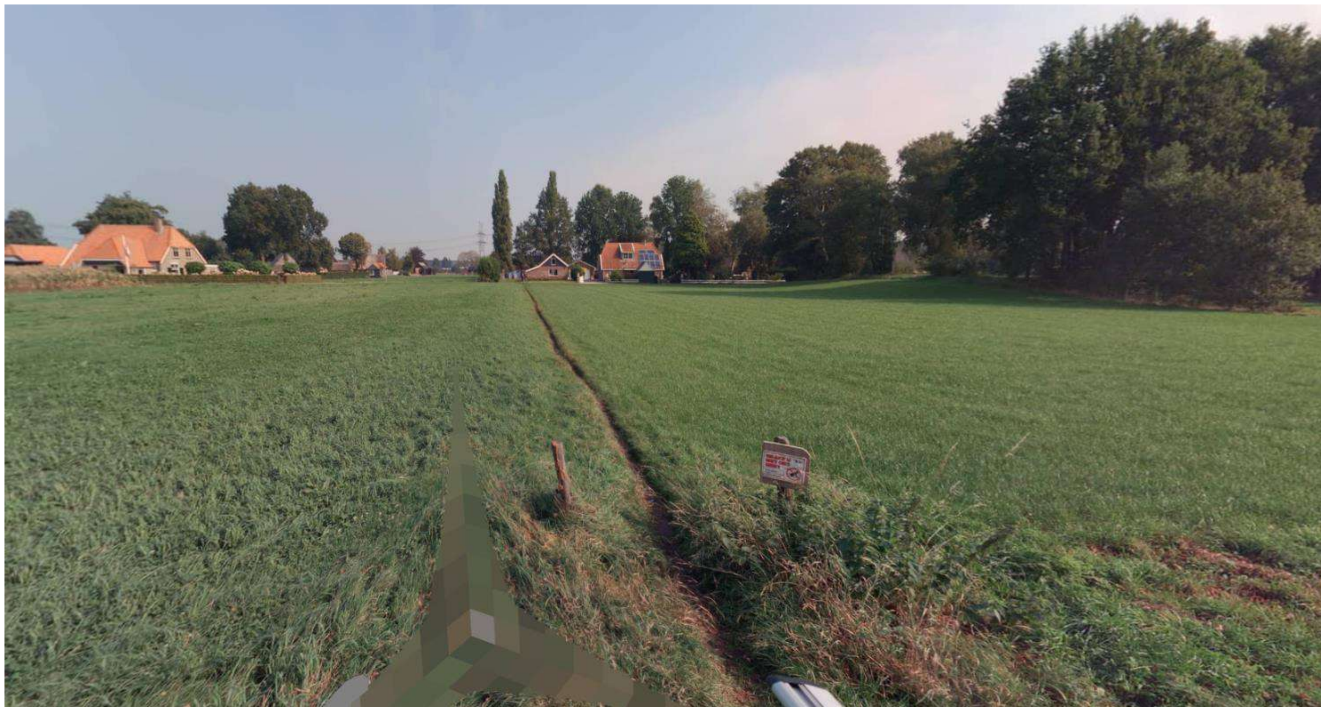
Weg nummer 239