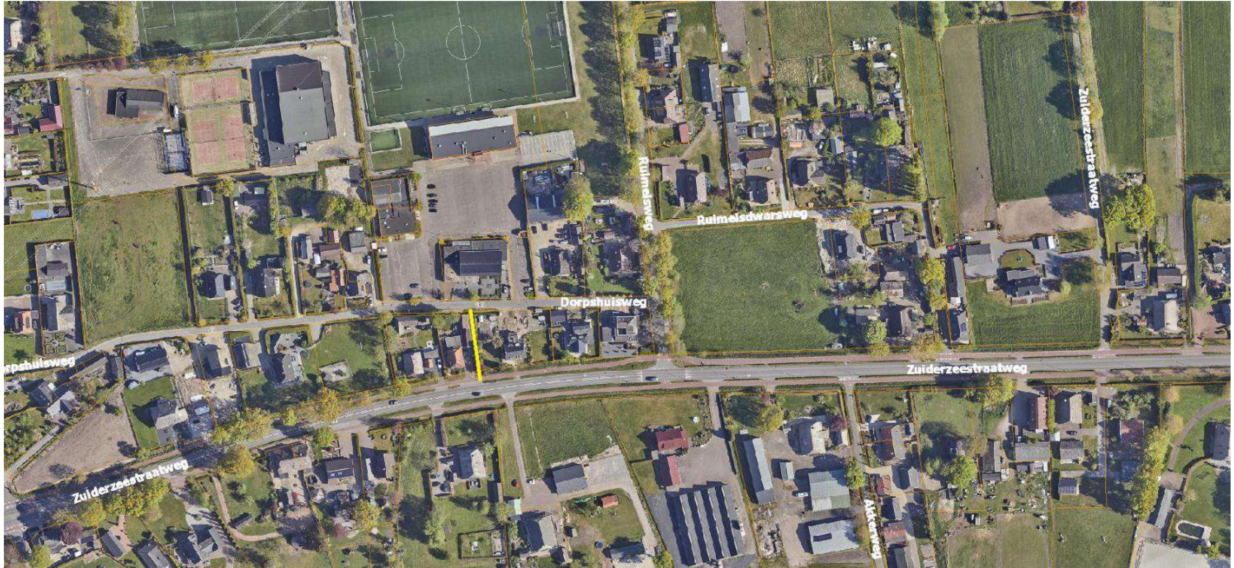
Pad Dorpshuisweg - Zuiderzeestraatweg