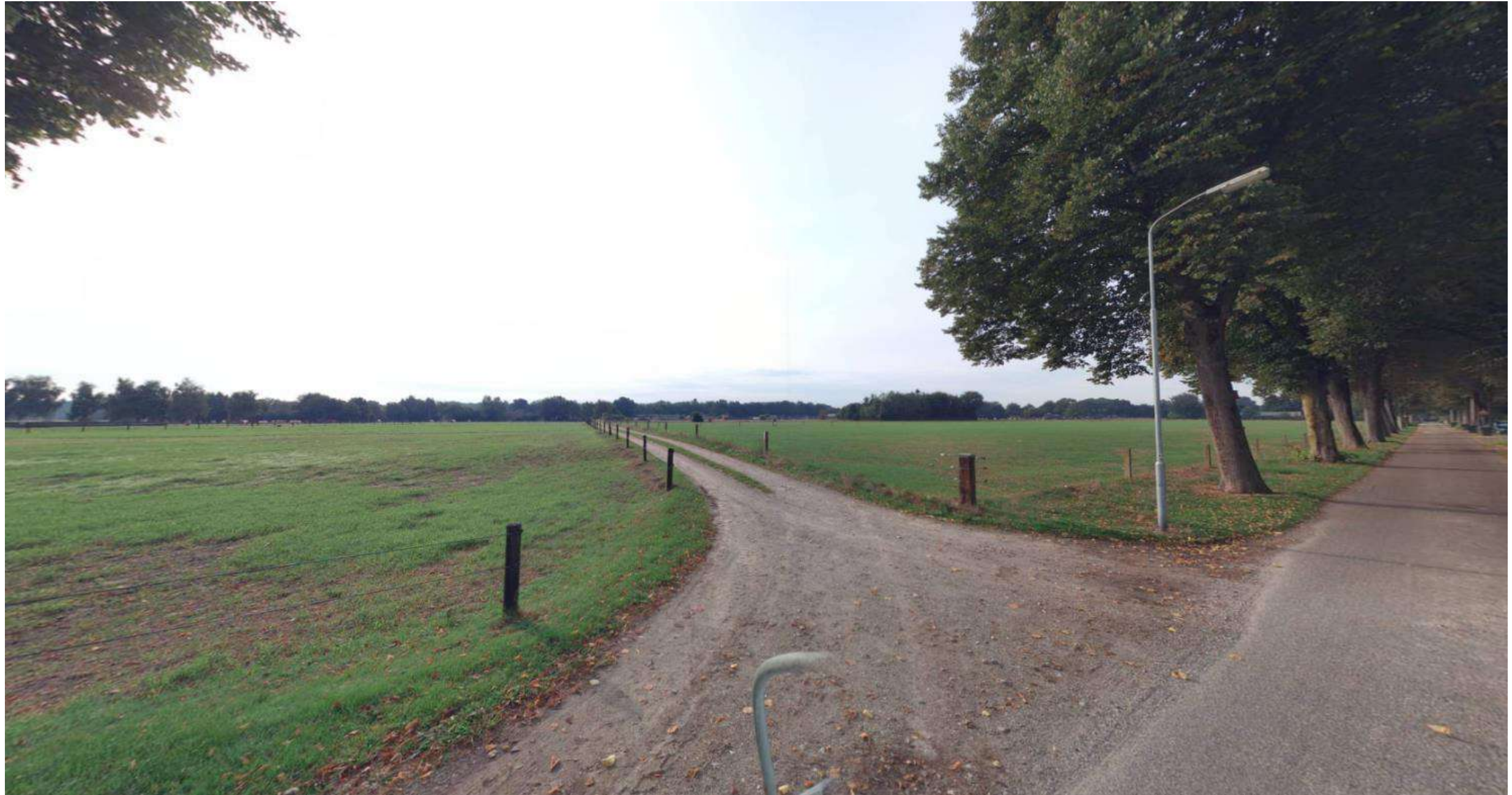
Weg nummer 241