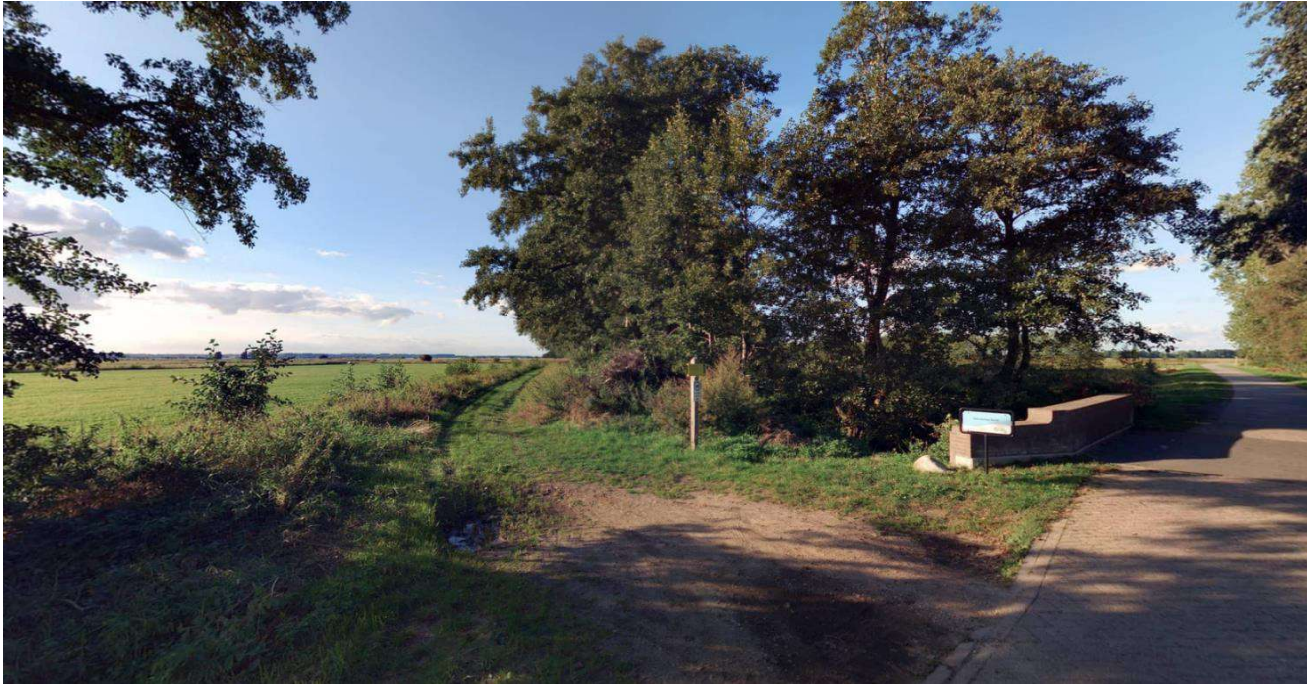
Weg nummer 238