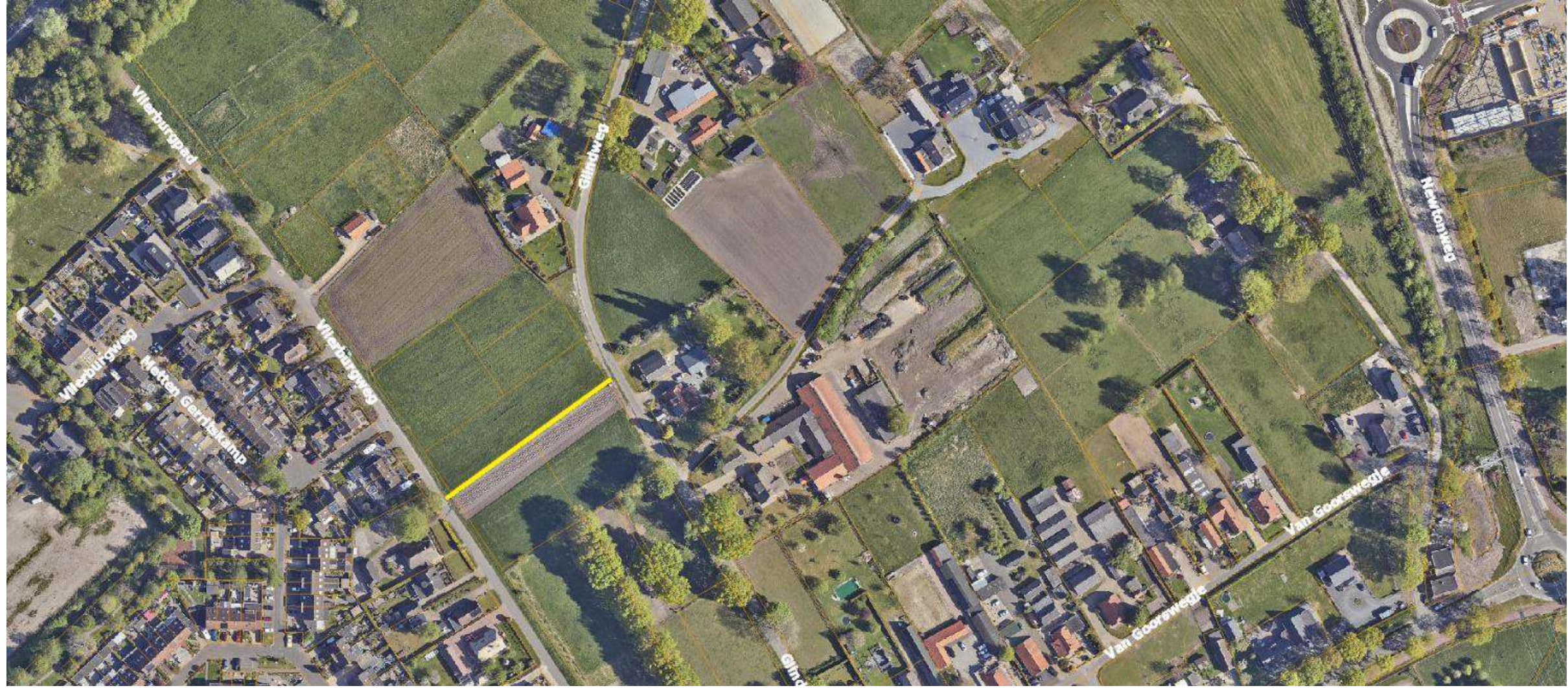
Weg nummer 239