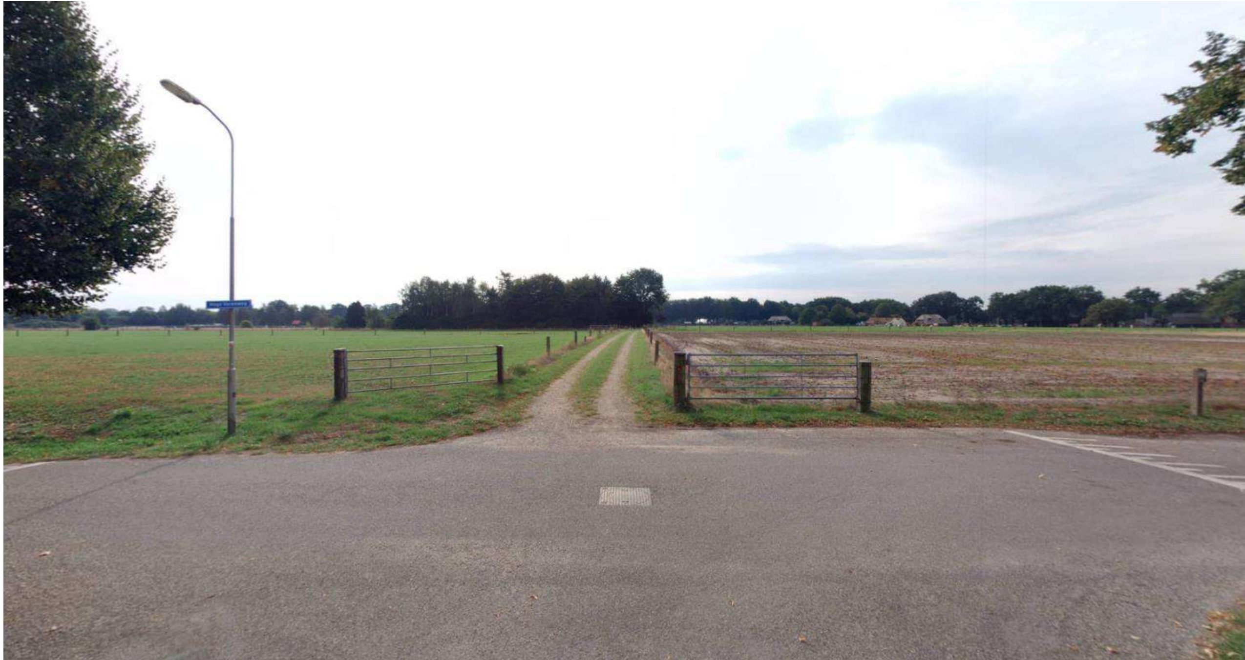
Weg nummer 240