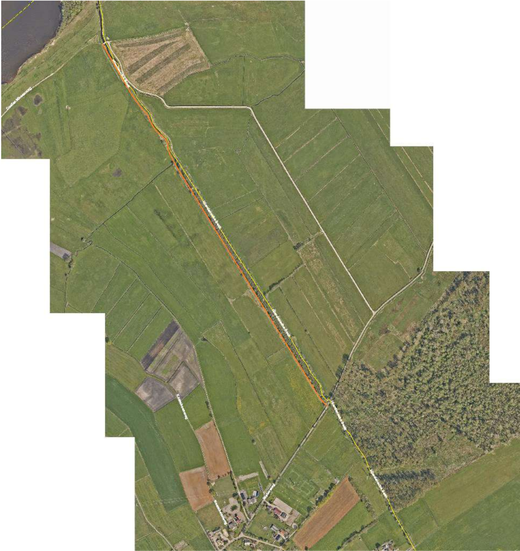
Weg nummer 238